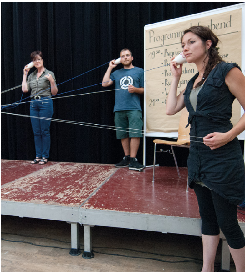
Studierende bei der Präsentation der Ergebnisse

Die Steuergruppe genehmigte die vorgeschlagenen Schwerpunkte und so erstellten die Freiwilligen unter tatkräftiger Mithilfe der IFSA-FHS-Projektleitung zwischen November 2014 und März 2015 die Detailumsetzungskonzepte.