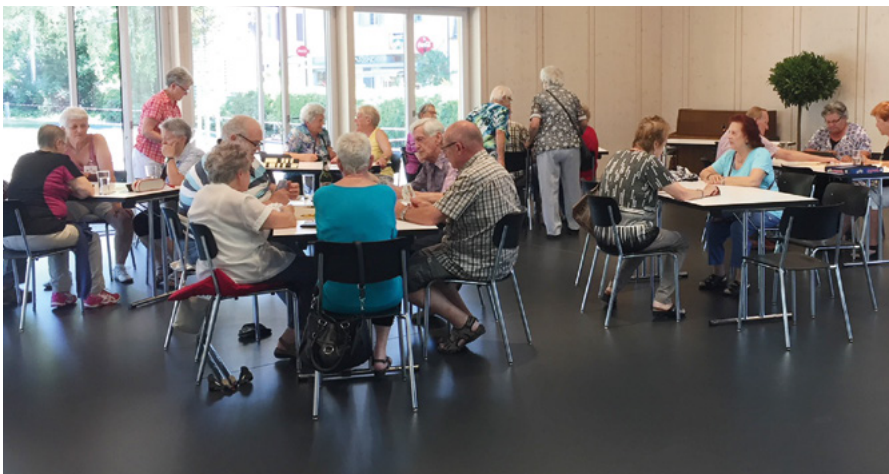
Der Begegnungsort im VIVA

→ Jeden Montag, Begegnungszentrum VIVA, Kurzdorf, 14.00 - 17.00 Uhr → kurzdorftraeff@awiq.ch