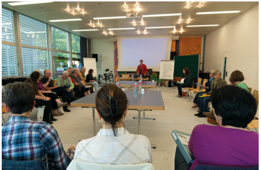
Vielfältige und gute Durchmischung der Projekt-Teilnehmenden

Mit zu dieser Durchmischung hat die Art beigetragen, wie zur Mitarbeit aufgerufen wurde: Zeitungsartikel, Medienarbeit, Flyer, die in alle Haushalte gehen, öffentliche Informationsveranstaltung zu den Ergebnissen mit Anmeldeöglichkeit zur Mitarbeit – alle diese Kommunikationsmassnahmen haben es der breiten Bevölkerung ermöglicht, sich zu melden und mitzuwirken. Auch wenn