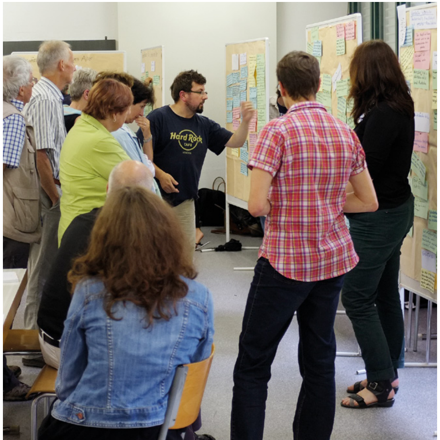
Studierende und Quartierbewohnende

Überzeugungsarbeit bei der Quartierbevölkerung ist gewiss noch hinsichtlich der Bereitschaft nötig, Hilfe und Unterstützung anzunehmen, zumal die Angebote Nachbarschaftshilfe und Talentbörse als niederschwellige Hilfsan-