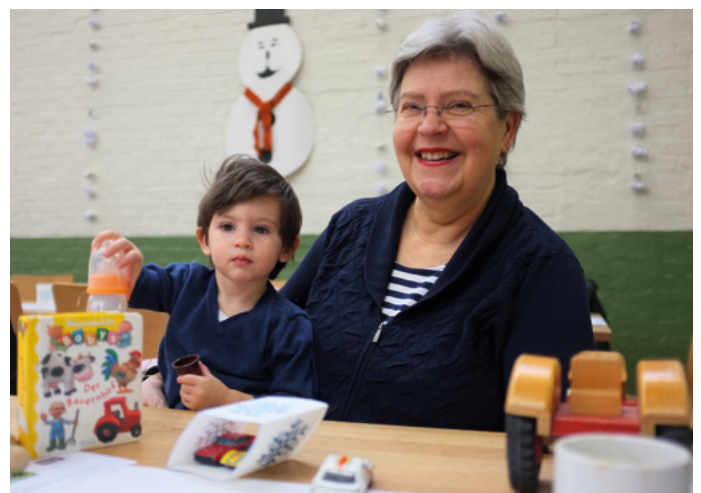
Dreikönigstag 2016: Eröffnung des Begegnungsortes «Kurz-Dorf-Träff»

Begegnungsort. Aus AWIQ sind verschiedene Teilprojekte entstanden, die im Lauf des Jahres 2016 ihren ordentlichen Betrieb im Quartier aufgenommen haben: «Kurz-Dorf-Träff» als offener Begegnungsort, die Nachbarschaftshilfe/Talentbörse Kurzdorf zur Vermittlung von niederschweligen, unentgeltlichen Freiwilligeneinsätzen, die IG Wohnen, deren Vision einer generationendurchmischten Genossenschaftssiedlung gute Realisierungschancen hat, sowie die AG Verkehr, die Impulse für die Verbesserung des öffentlichen Verkehrs im Quartier erarbeitet hat. Darüber hinaus hat eine aus Freiwilligen bestehende Arbeitsgruppe eine vollständige Liste aller Angebote im Sport- und Kulturbereich für Personen über 50 Jahre recherchiert. Die Aufstellung wurde der Fachstelle für Alters- und Generationenfragen übergeben; diese nutzt die Aufstellung, um Interessierte zu informieren. Ebenfalls