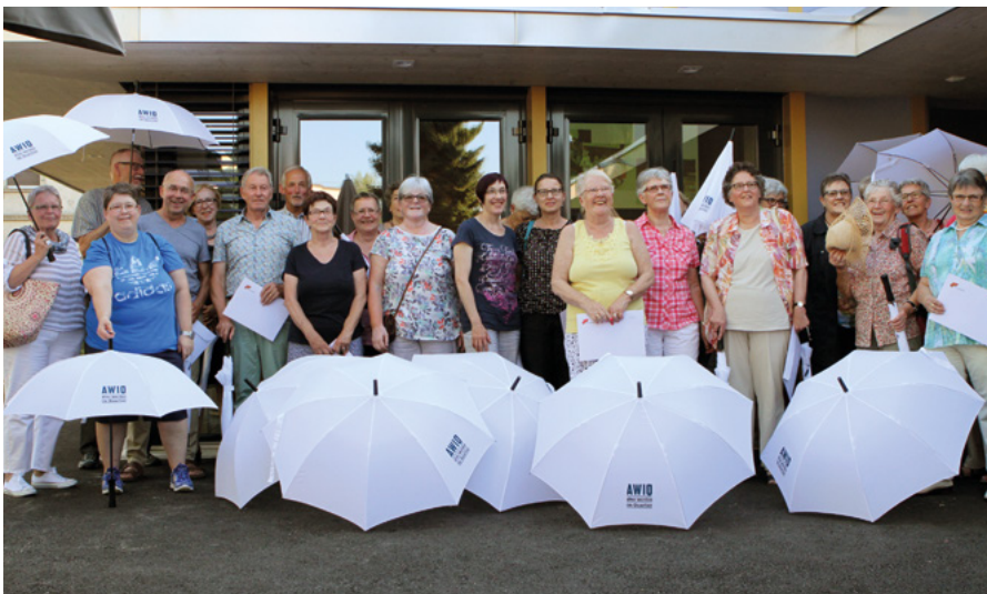
Abschlussveranstaltung mit den Freiwilligen

Freiwilligen-Stunden in den Arbeitsgruppen