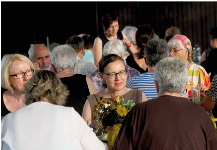
Gemeinsame Identität: Freiwilligen-Feier des «Kurz-Dorf-Träffs»

die Zusammenarbeit von Anfang an und spielte eine zentrale Rolle, um den Enthusiasmus der Freiwilligen zu befördern und damit weitere Freiwillige zu motivieren (Hegedüs, Wepf, Otto 2017:16).