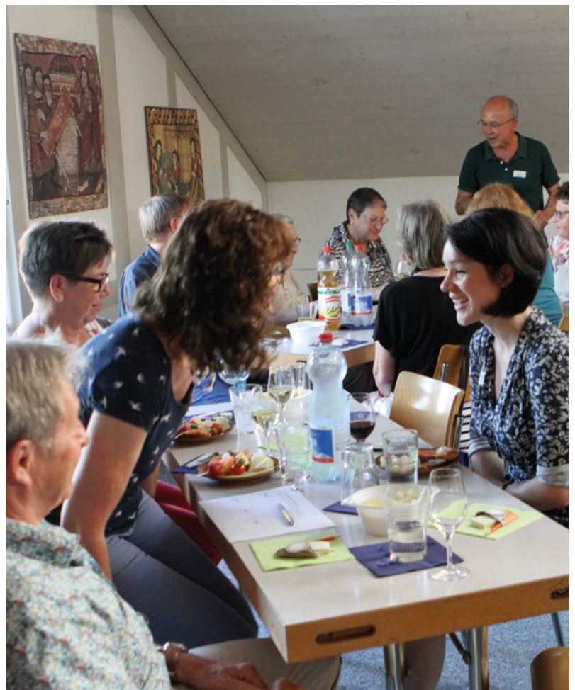
Kennenlern-Treff der Freiwilligen für die Nachbarschaftshilfe/Talentbörse

→ Vermittlungsstelle 052 511 05 30, erreichbar Dienstag, 9.00 - 11.00 Uhr, und Donnerstag, 14.00 - 16.00 Uhr → nbh-kurzdorf@awiq.ch talentboerse@awiq.ch