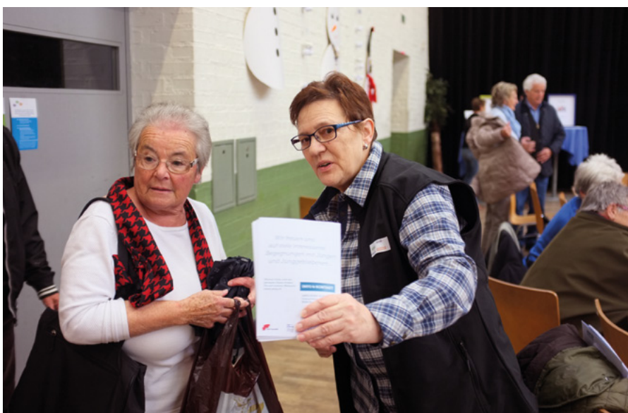
Hohe Motivation der Freiwilligen für ihr Engagement

In anderen Teilprojekten entwickelten sich die Freiwilligen persönlich weiter und lernten neue Fähigkeiten – von Kassaführung bis zur Bedienung von Excel (Kuchen 2016:27; Hegedüs, Wepf, Otto 2017:15). «In den Interviews mit den Engagierten wird der Eindruck deutlich, dass im Laufe der ersten Phasen alle ihr persönliches Spezialgebiet (ein passendes Ämtli, ihre Nische) gefunden haben. Dies scheint auch seitens der Projektleitung ein Anliegen zu sein, an dessen – so mehrere Stimmen – erfolgreicher Umsetzung sie bedeutsamen Anteil hat.» (Otto, Zanoni, Wepf 2015:7). Die Kompe-