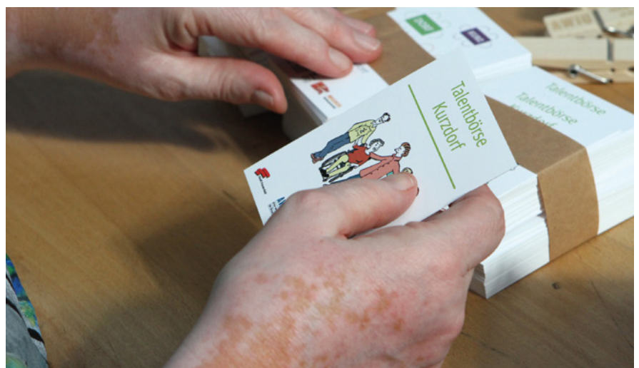
Vorbereitung Werbeaktion für die verschiedenen AWIQ-Angebote