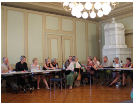
Treffen der Freiwilligen, der Steuergruppe und dem Stadtrat

Bereichen Alter und Gesundheit, Bau und Verkehr sowie Bevölkerung und Soziales und dem im März neu gewählten und am 1. Juni 2015 ins Amt eingetretenen Stadtpräsidenten organisiert.