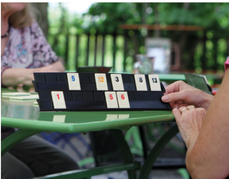
Spielnachmittag im «Kurz-Dorf-Träff»

Auch die Generationenmischung könnte noch stärker werden. Möglicherweise liegt es daran, dass vor allem Berufstätige andere Tagesrhythmen als die älteren Menschen haben. In der Praxis hat sich auch gezeigt, dass der im ersten Betriebsjahr einmal im Monat angebotene Mittagstisch keinem Bedürfnis entspricht, er fand an 6 von 11 Terminen