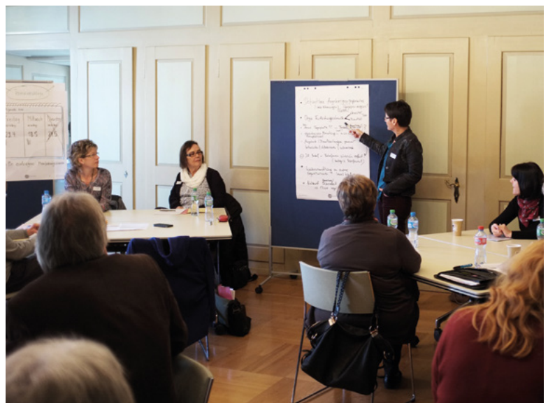
Workshop mit professionellen Dienstleistungsanbietenden (Februar 2016)

Im November 2016 wurde schliesslich das «Netzwerk altersfreundliches Frauenfeld» mit 31 Personen aus 29 Organisationen gegründet. Geplant sind zwei bis drei Netzwerkveranstaltungen pro Jahr (Hegedüs, Wepf, Otto 2017:17 - 19; Kuchen, Maag 2015; Kuchen 2016:9 - 15, 25).