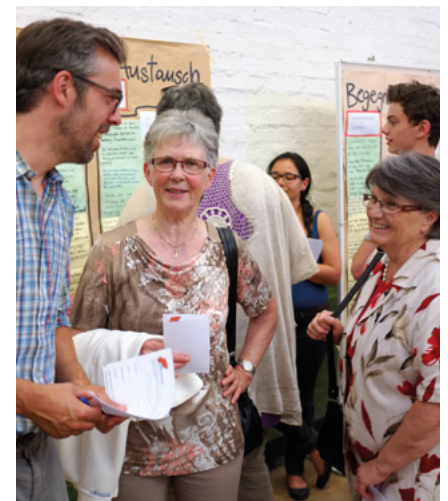
Präsentation Ergebnisse Erhebungswoche

Seit Beginn positive Berichterstattung in den lokalen Medien