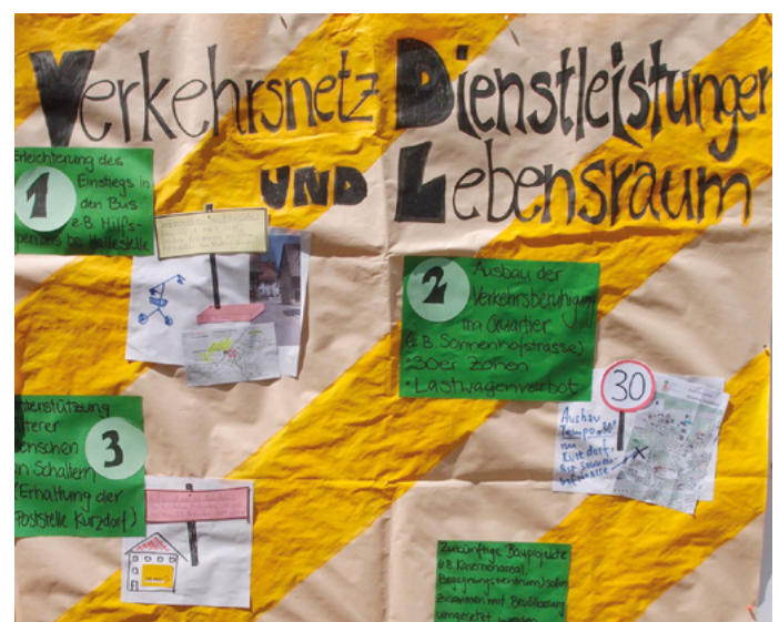
Plakat aus der Erhebungswoche

Es stellte sich heraus, dass viele Ideen aus der Gruppe entweder mit Massnahmen korrespondierten, die die Stadtbuserverwaltung in ähnlicher Form bereits geplant hatte, oder – was die Anpassung der Bedienung der Billettautomaten für die ältere Bevölkerung anbelangt – technisch nicht realisierbar